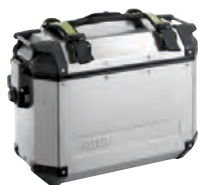
E143 Přídavná madla pro přenášení kufří