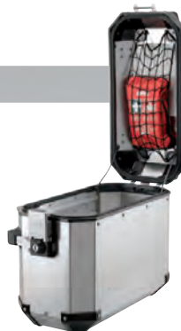
E144 Vnitřní síťka do víka