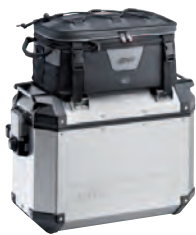
XS310 Taška na horní víko