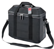
T499 Vnitřní taška pro for Trekker Outback 37 lt