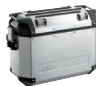
E145 Pár samolepicích odrazek